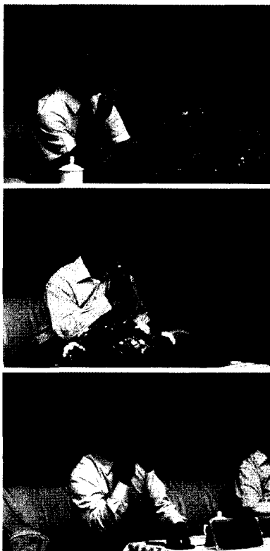
海尔、小天鹅、荣事达三家企业的老总在现场接受媒体的提问。

海尔、小天鹅、荣事达三家企业的老总也现场接受了媒体的提问,现场气氛轻松融洽。这些企业一直以来都非常重视产品技术的自主研发能力,投入大量人力物力建造自己的实验室,使得自己的品牌具有出众的设计水平,从而生产出具有品牌特色的产品。这6款产品能够通过6A检测,充分说明了我们的本土企业已经一改以往的单纯模仿,具备自主研发并可与国外品牌相媲美的实力。